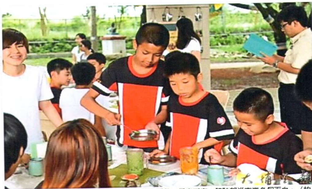
埔里鎮忠孝國小舉辦「米其林餐桌」食農教育活動，學童下廚，體驗稻米產業各個面向。

校方表示，期盼透過這場實務的校園餐桌料理體驗，具體呈現農民對農村文化的情感與體會，學童們興致很高，食農教育其實可以很知性、也很有趣。