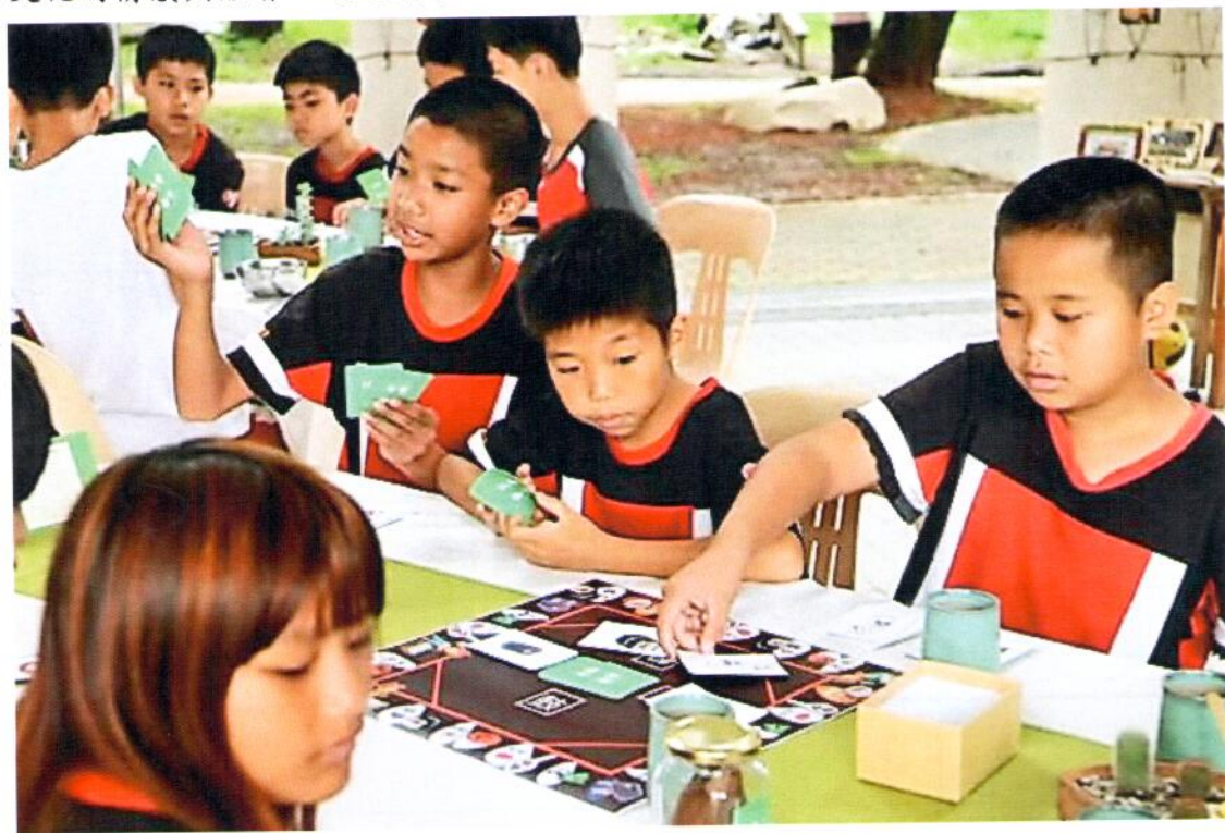
暨大觀餐系畢業專題師生所組成的鼓勵穀粒團隊，進入忠孝國小進行食農教育探索，圖為小朋友透過桌遊認識穀物。

校方表示，期盼透過這一場實際的校園餐桌料理體驗，具體呈現農民對農村文化的情感與體會，透過農事及料理體驗，讓食農教育活絡了起來。