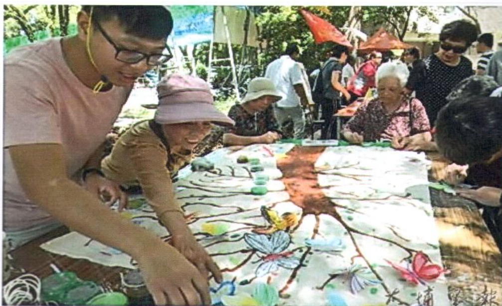
2016埔里生態城鎮園遊會，老人家在大樹上繫上紙蝴蝶，表達守護大地的理念。

生態城鎮園遊會推廣宜居城鎮、生態城鎮觀念，招募的攤位主要來自埔里在地社團社群，無論是調查守護水資源的農民、宣導廢氣減排的摩托車店、呼籲用廢油做肥皂的家庭主婦、倡議好空氣follow me的埔里PM2.5空汙減量自救會、騎驢生態導覽志工、自行車電動車低碳載具體驗等對於守護環境理念認同的社團或個人，都能來設攤，今年已舉辦第4屆。