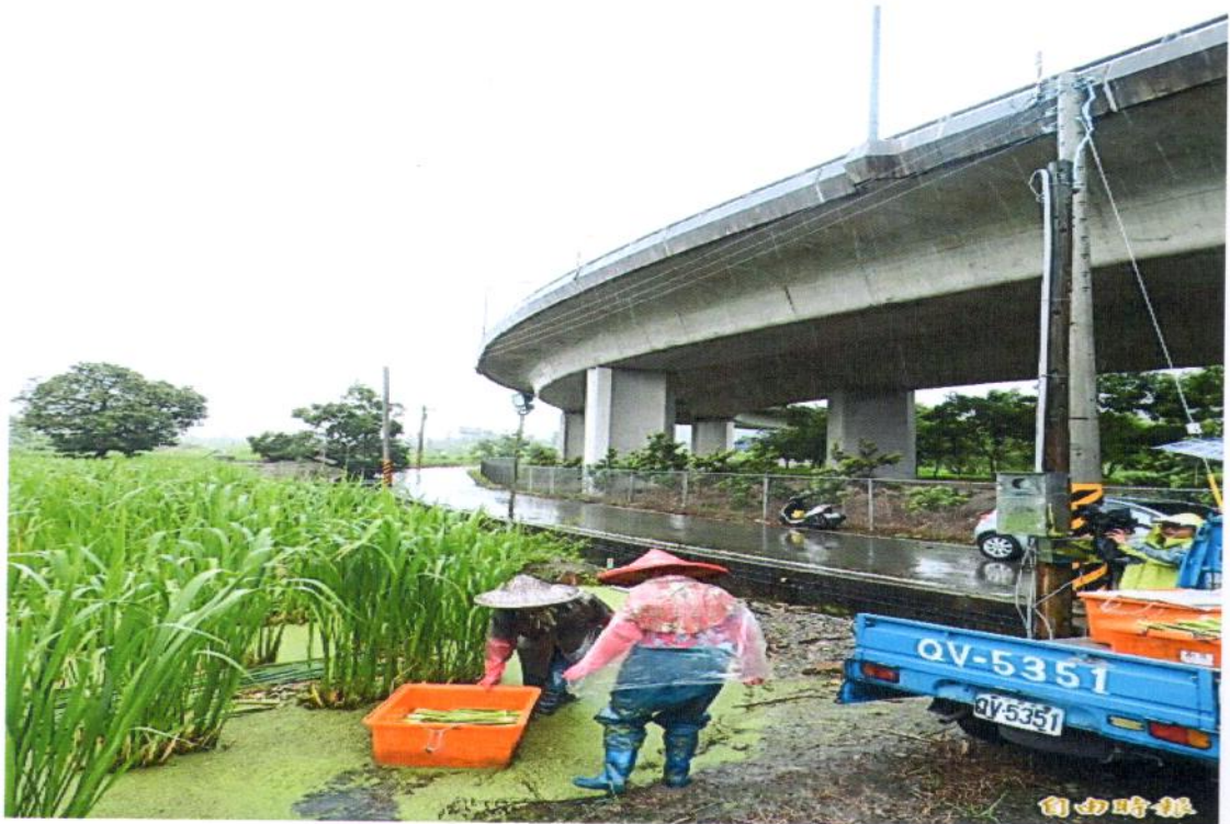
許多農民的農田緊鄰愛蘭交流道匝道彎道，農民得防備垃圾從天而降。

全長約37公里的國道6號，由台中霧峰到南投埔里，沿途青山綠水，加上兩側嚴禁大型廣告物，而有「全台灣最美國道」之稱，其中之一的愛蘭交流道設置造型特殊的脊背橋，國6通車後也成為埔里新地標，但在附近耕作的農民多年來則是飽受垃圾從天而降之苦。