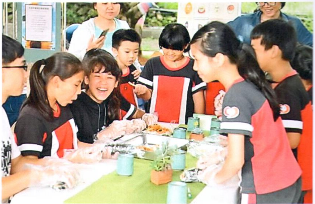
暨大觀餐系畢業專題師生所組成的鼓勵穀粒團隊進入忠孝國小進行食農教育的探索，圖為學童試做壽司。(廖肇祥攝)