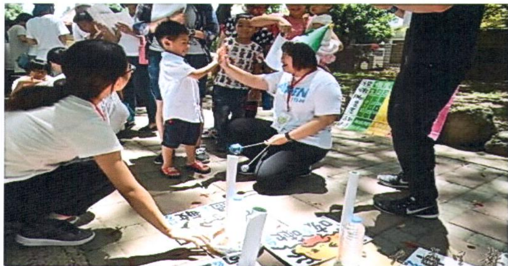
2016埔里生態城鎮園遊會，PM2.5空汙減量自救會以壽圈圍關卡傳遞空汙物質，會在人身造成多樣症狀。

【柏原祥 / 埔里報導】2017埔里生態城鎮園遊會招募攤位，將在5月6日上午於埔里藝文中心旁啄木鳥步道舉辦，這個園遊會以生態、永續、環保、有機農業等主題，邀集埔里山城裡想要傳達守護環境意識的民眾設攤，以有趣的闖關遊戲，讓大人與孩子們瞭解人與土地、環境之間可以和平相處、共存、共榮。