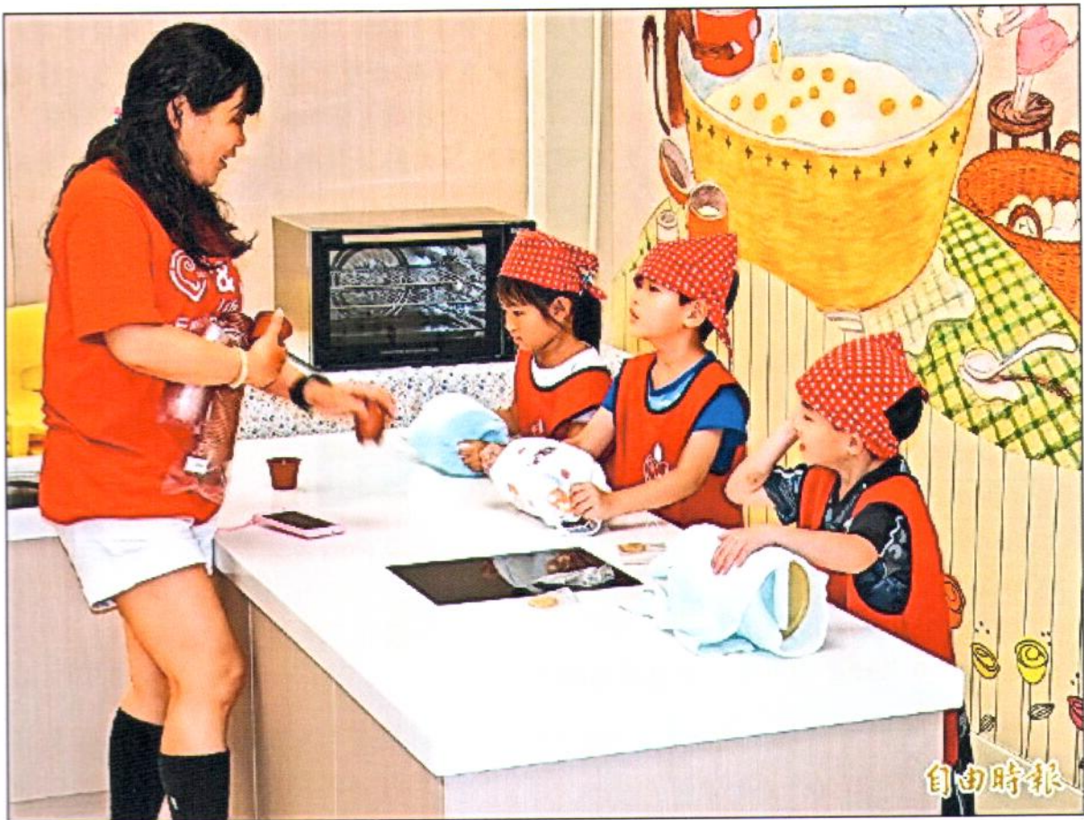
幼兒園還有專為小朋友設計的烘焙坊，讓學童學習動手做。(記者佟振國攝)