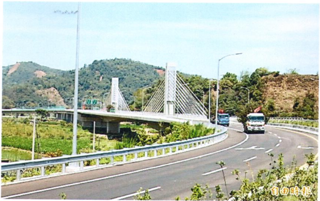
國道6號愛蘭交流道的脊背橋為國道車流進入埔里的新地標。