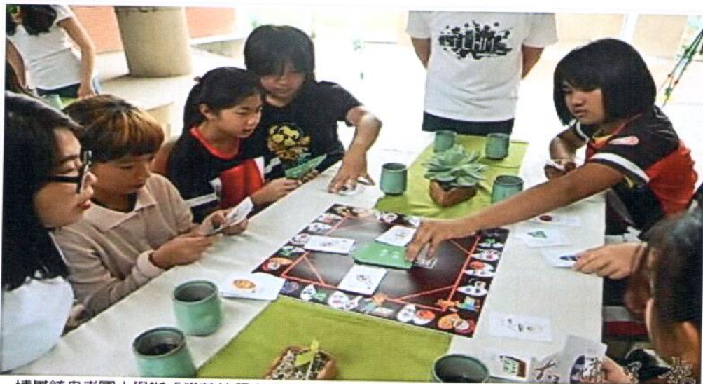
埔里鎮忠孝國小舉辦「米其林餐桌」食農教育活動，學童玩桌遊，瞭解台灣稻米產業特色。

在暨大人社中心安排下，暨大觀餐系三年級同學進駐忠孝國小前，即帶領學童進到暨城社區金海伯的田裡，與老農賴克祥學習插秧、巡田水，赤腳親近土地，認知農民耕作的辛勞，體驗糧食來之不易，再進行自種米之預購販售，26日還進駐忠孝國小高年級小朋友課堂，透過桌遊學習稻米知識，還手作壽司，師生們共同進行了食農教育的理解與省思。